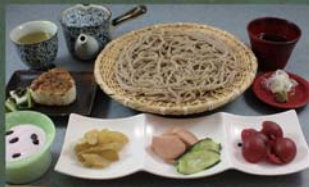
サービスセット 1,200円