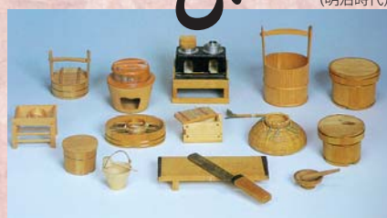
木製ままごとセット(明治時代)