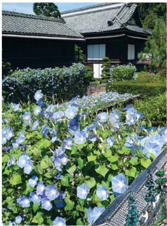
ヘヴンリーブルー (8月~10月初旬見頃)