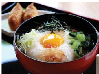
とろろ蕎麦(紫米いなり付) 950円(税込み)