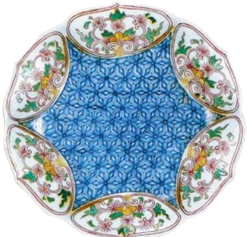
江戸時代の鍋島焼き