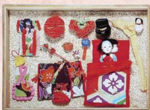
衣装替え人形セット