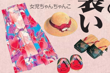
女児ちゃんちゃんこ