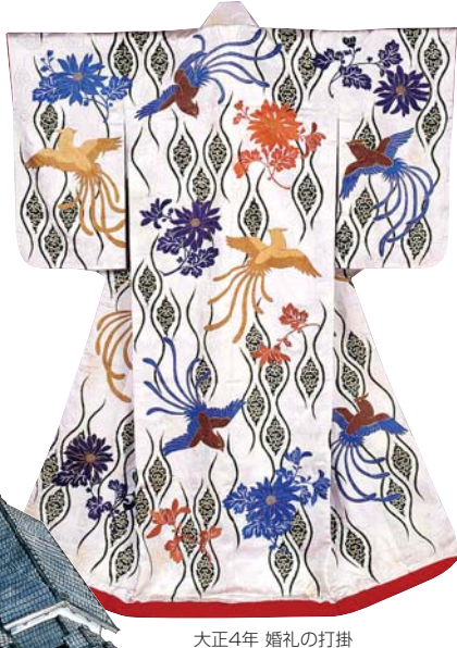
大正4年 婚礼の打掛